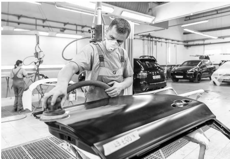
Госэкспертиза покажет, правильно ли начислены компенсации за вредность