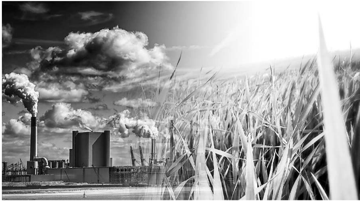
Чтобы работать без штрафов, нужно соблюдать все требования экологического законодательства

День экологических знаний, который ежегодно отмечают во многих странах мира 15 апреля, нацелен на решение проблем охраны природы, в том числе на производствах. О значении экологической безопасности, в частности обучения, обычно знают на каждом крупном предприятии. Напомним, какие требования законодательство предъявляет к специалистам этого профиля.