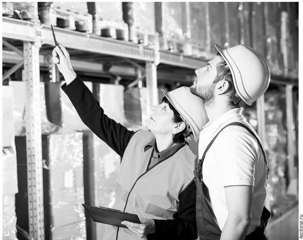
Во время профвизита инспектор труда может указать работодателю на риски нарушений и помочь их устранить

– Последние годы мы активно используем в своей работе меры профилактики, это позволяет предупредить нарушение трудовых прав. В 2023 году по сравнению с 2022 годом мы на 80 процентов сократили количество проверок. Зато на 30 процентов увеличили число профилактических мероприятий – провели их больше миллиона. Особенно отмечу профилактический визит, во время которого инспектор труда может указать работодателю на риски нарушений и помочь их устранить. В 2022 году инспекторы труда провели 118 тысяч таких профвизитов, а в 2023-м уже 190 тысяч. Стало заметно, что работодатель начинает вос-