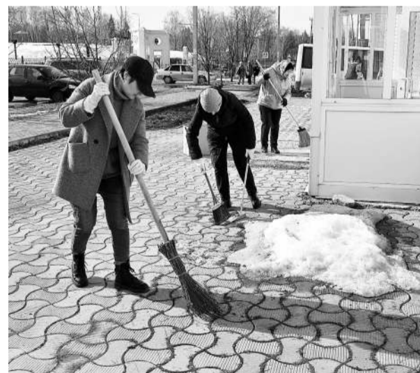
Субботник в выходной – дело добровольное

✓ для предотвращения катастрофы, производственной аварии либо устранения последствий